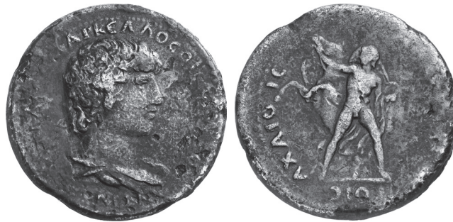
Typ 6.10: AE Korinth, Antinoos / Bellerophon mit Kerykeion.

darum das erste unveränderte Exemplar des Typus „Pegasos und Bellerophon mit Kerykeion“. Es soll hier im Rahmen der gesamten Emission des Hostilios Markellos vorgestellt und interpretiert werden. Auch für uns überraschend ergaben sich dabei aus dem weiteren Zusammenhang Hinweise auf die Reiseroute Hadrians in den Jahren 131 und 132 (Karte 1–2) sowie Hinweise auf einen Kaiserbesuch in Korinth und Isthmia im November 131.