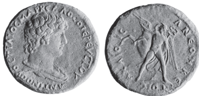
Typ 6.11: AE Korinth, Antinoos / Bellerophon mit Kerykeion. P. Naster, La Collection de Lucien de Hirsch (Brüssel, 1959), Taf. LXX, 1336.