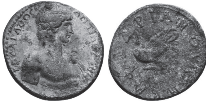
Abb. 12: AE, Hadrianoutherai. Antinoos / Bär. A. Backe, Antinoos: Geliebter und Gott , S. 41, Nr. 23.

Weist der eine Reversstypus auf den berühmtesten Protagonisten der Stadtgeschichte hin, so unterstreicht der Andere die Beziehungen Kymes zu Athen, gewiß im Stillen mit Augenmerk auf die anstehende Gründung des Panhellenions durch Hadrian. Wenn man in Kyme darauf verzichtete, auf den Medaillonreversen Antinoos zum Thema zu machen, und stattdessen lieber rein lokalen Themen den Vorzug gab, so scheint in der Zurückhaltung eine gewisse Unsicherheit zu liegen. Die Medaillonvorderseite nennt den neuen Gott noch recht unverbindlich und allgemein gehalten ΗΡΩΣ. Offenbar waren im Vorfeld des Kaiserbesuchs noch keine Richtlinien bekanntgeworden, wie mit dem neuen Gott umzugehen sei.