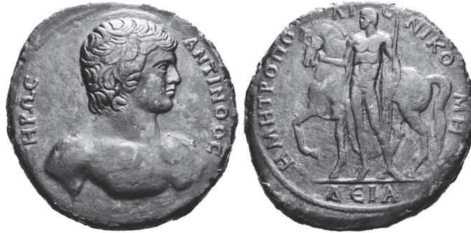
Abb. 15: AE, Nikomedeia. Antinoos / Jüngling m. Pferd.