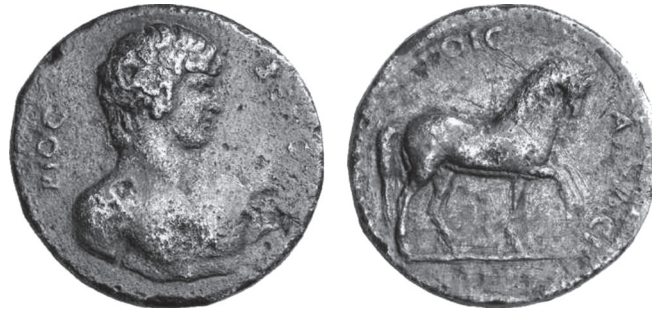
Abb. 5: AE, Mantinea. Antinoos / Pferd. BCD Peloponnes: The BCD Collection. Coins of Peloponnesos , bearbeitet von A. S. Walker. LHS Auction 96, May 8–9, 2006, Zurich, Nr. 1494.