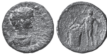
Abb. 4: AE, Korinth. Caracalla / Isthmos. BCD Korinth: Sammlung BCD. Münzen von Korinth , bearbeitet von F. Eggers. Numismatik Lanz, Auktion 105, 26. November 2001, München, Nr. 927.

Pinienkranz das zentrale Symbol der Spiele; er wird als Rahmung des Wortes \text{ΙΣΘΜΙΑ} , auf Preistischen liegend oder zusammen mit dem Gründerknaben Palaimon abgebildet. 21 Lag der Auffindungsort des Palaimon außerhalb des Heiligtums, so wurde der Kult des Palaimon im Adyton und im Rundtempel neben dem Poseidontempel ausgeübt. 22 Der Medaillontypus war aufgrund der sich aufdrängenden Parallele zwischen dem ertrunkenen Heros Palaimon und dem ertrunkenen Antinoos sehr sinnfällig; Gründungssage, Kult und Topographie des panhellenischen Heiligtums in einem Bild zusammenfügend, bildet er geradezu den Kern der Reversbildserie zu den Aitia der Isthmia.