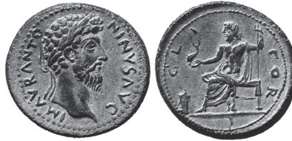
Abb. 2: AE, Korinth. Marc Aurel / Poseidon. BCD Korinth: Sammlung BCD. Münzen von Korinth , bearbeitet von F. Eggers. Numismatik Lanz, Auktion 105, 26. November 2001, München, Nr. 683.