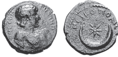
Abb. 19: AE, Nikopolis. Antinoos / Mondsichel u. Stern. Fritz Rudolf Künker GmbH & Co. KG 133, 11. Okt. 2007, Nr. 8845.