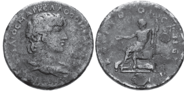
Typ 1.1: AE Korinth, Antinoos / Poseidon. BCD Korinth: Sammlung BCD. Münzen von Korinth , bearbeitet von F. Eggers. Numismatik Lanz, Auktion 105, 26. November 2001, München, Nr. 648.