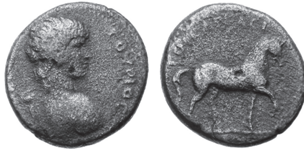
Abb. 7: AE, Mantinea. Antinoos / Pferd. CNG, Mail Bid Sale 63, 21. Mai 2003, Nr. 1002.