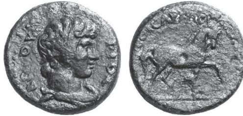
Abb. 9: AE, Mantinea. Antinoos / Pferd. BCD Peloponnes: The BCD Collection. Coins of Peloponnesos , bearbeitet von A. S. Walker. LHS Auction 96, May 8–9, 2006, Zurich, Nr. 1496.

Markellosmedaillons schlägt dieselbe Saite an. 41 Eine Datierung der Vetouriosemission in den Herbst 131 oder Winter 131 auf 132 sowie ein Kaiserbesuch in Mantinea sind nicht zuletzt aufgrund der auflagenstarken Emission, die für das kleine, noch im Wiederaufbau befindliche arkadische Landstädtchen völlig aus dem Rahmen seiner sonstigen Prägetätigkeit 42 fällt, sehr wahrscheinlich.