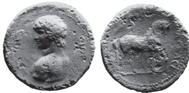
Abb. 8: AE, Mantinea. Antinoos / Pferd. G. Blum, Numismatique d'Antinoos, JIAN 16 (1914), Taf. I, 19.

läßt sich die Weitergabe eines Vorderseitenstempels mit dem Antinoosbildnis von einer Stadt an die andere nirgends feststellen. 36