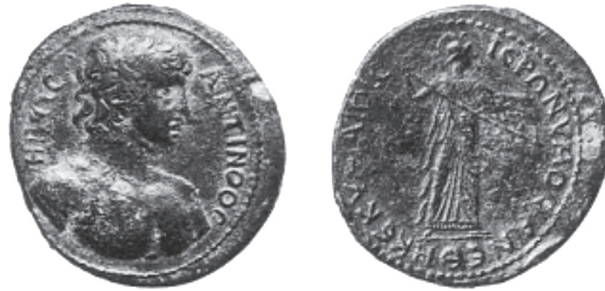
Abb. 10: AE, Kyme. Antinoos / Athena. A. Backe, Antinoos: Geliebter und Gott , S. 41, Nr. 24.