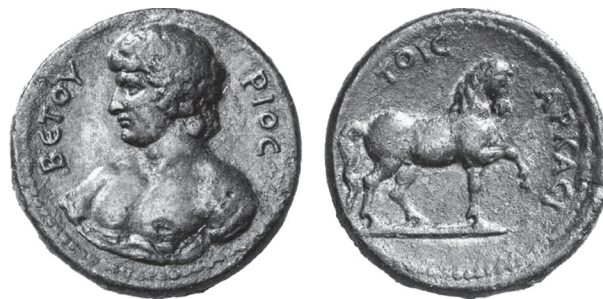
Abb. 6: AE, Mantinea. Antinoos / Pferd. BCD Peloponnes: The BCD Collection. Coins of Peloponnesos , bearbeitet von A. S. Walker. LHS Auction 96, May 8–9, 2006, Zurich, Nr. 1501.

Zeitpunkt denkbar, erklärte er die Münzstiftungen des Markellos in Korinth (Abb. Typ 1.1–7.12) und des Veturios in Mantinea (Abb. 5–9) als Ausdruck eines „confidently“ erwarteten Kaiserbesuchs. In Vorbereitung dessen seien der „Alpheiosmaster“ und seine „assistants“ „before the middle of A.D. 134“ auf die Peloponnes gereist und hätten im Herbst dieses Jahres die Prägungen besorgt. 34 Jedoch, jene angeblich für das Jahr 134 geplante Griechenlandreise Hadrians ist eine moderne Fiktion. Wie den neuesten Inschriftenfunden zu entnehmen ist, hielt sich der Kaiser ab April 133 in Rom auf. Ferner ist seine Anwesenheit in Rom für den 5. Mai 134 bezeugt. In der zweiten Hälfte des Jahres 134 residierte er einige Zeit in Neapel, um dort mit Gesandten der Theatersynodos, der Provinzen und Städte die neue Festspielordnung zu auszuarbeiten. 35