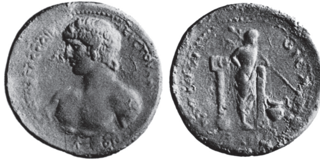
Typ 3.5: AE Korinth, Antinoos / Dionysos. Auktion Slg. Prince Waldeck, Münzhandlung Basel 3, 1935, Nr. 454.

Hinter dem Gott (in der dreidimensionalen Realität aber wohl eher neben ihm zu denken) ist ein weiterer Pfeiler zu sehen, der einen zweigeteilten Pinax (also ein Diptychon) trägt.