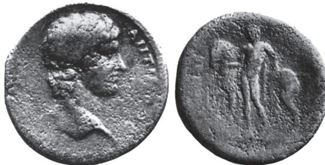
Abb. 16: AE, Nikomedeia. Antinoos / Jüngling m. Pferd. Münzen u. Medaillen AG Basel 52, 1975, Nr. 644.