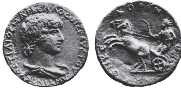
Typ 2.2: AE Korinth, Antinoos / Helios. G. Blum, Numismatique d'Antinoos, JIAN 16 (1914), Taf. I, 15.

erwähnte Wagengruppe auf den Propylaia zur Agora von Korinth, 11 läßt sich nicht mehr feststellen. Es bleibt aber festzuhalten, daß Antinoos auf beiden Medaillontypen zwei bedeutenden Gottheiten der Stadt (Poseidon und Helios) angeglichen wurde.