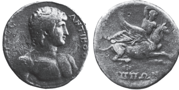
Abb. 17: AE, Kalchedon. Antinoos / Apoll auf Greif. Numismatik Lanz, Auktion 22, 1982, Nr. 689.