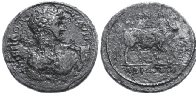
Abb. 14: AE, Kios. Antinoos / Stier. CNG, Electronic Auction 130, 2006, Nr. 282.

weig nach Nikaia sowie ihres ausgebauten Hafens würde ein Auftrag an unser Atelier (im Sinne einer stringenten Reiseroute) dennoch nicht überraschen.