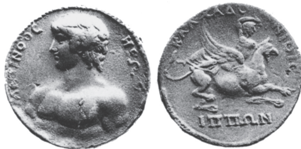
Abb. 18: AE, Kalchedon. Antinoos / Apoll auf Greif. G. Blum, Numismatique d'Antinoos, JIAN 16 (1914), S.47 Nr. 1, Taf. III, 9.

Für den weiteren Verlauf der Reiseroute ist ein inschriftlich überlieferter Brief Hadrians von Bedeutung, der ins Jahr 131/132 datiert (16. Trib. Pot. = 10. Dez. 131– 9. Dez. 132). 63 Der Brief behandelt den cursus publicus zwischen Maroneia, Abdera und Philippi sowie die Überfahrt nach Samothrake. Zeile 7 der Inschrift wird von den Herausgebern so interpretiert, daß der Kaiser sich auf eigene, anlässlich eines Besuchs in Maroneia und Abdera gemachte Anschauung berufe. Wenn dem so war, muß Hadrian einige Zeit vor der Niederschrift durch die Städte Maroneia (vielleicht mit einem Abstecher nach Samothrake), Abdera und wahrscheinlich Philippi gekommen sein. Dieser Teil der Reise dürfte in den Spätsommer 131 fallen; das darauf bezugnehmende Schreiben könnte später in Athen verfaßt worden sein.