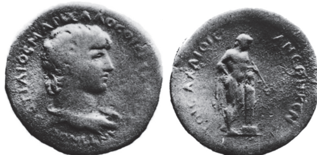
Typ 7.12: AE Korinth, Antinoos / Hermes. G. Blum, Numismatique d'Antinoos , JIAN 16 (1914), Taf. I, 13.

Bellerophon mit Hermes ist uns nicht bekannt. Es fällt aber auf, daß auch die zweite Prägung für die Achaioi Hermes zum Thema nimmt.