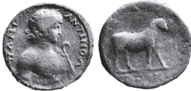
Abb. 13: AE, Kios. Antinoos / Stier. G. Blum, Numismatique d'Antinoos , JIAN 16 (1914), S.57 Nr. 2, Taf. IV, 14.