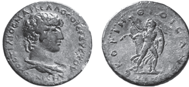
Typ 5.8: AE Korinth, Antinoos / Bellerophon. Gorny & Mosch 117, 14. Okt. 2002, Nr. 379.