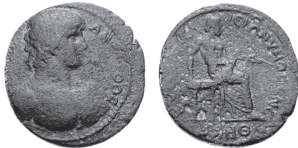
Abb. 11: AE, Kyme. Antinoos / Homer. CNG, Triton VIII, 2005, Nr. 722.

Die Kaiserreise von 124/5 kommt schwerlich in Frage, weil eines der drei fraglichen Epitheta Hadrians, Olympios, erst seit 129 regelmäßig in der Kaisertitulatur erscheint. 46 Die Reise des Kaisers im Jahr 129 scheidet gleichfalls aus: Nach der Überfahrt von Griechenland führte die Route den Kaiser von Ephesos aus in das südliche Kleinasien, ein Abstecher in die Aiolis ist unwahrscheinlich. 47 Tatsächlich steht nur das Jahr 131 zur Debatte, also genau jenes Jahr nach dem Tod des Antinoos, in dem Hadrian vom ägyptischen Alexandria nach Athen zurückzog. Die verkehrsgünstige Lage an der Strecke von Smyrna nach Pergamon sowie sein ausgebauter Hafen lassen Kyme als Etappe oder als Anlandestelle für eine Weiterreise nach Norden gut geeignet erscheinen. Der Ort dürfte den Kaiser—als mutmaßliche Geburtsstätte Homers—ohnehin interessiert haben: Er konnte dort seine einst dem delphischen Orakel vorgelegte Frage nach dem wahren Geburtsort Homers und nach dessen Eltern aufgreifen und mit den lokalen Gelehrten diskutieren. 48 Das Antinoosmedaillon mit dem sitzenden Homer (Abb. 11) gibt zumindest das Bemühen des Stifters Hieronymos zu erkennen, dem Kaiser die Homerthematik nahezubringen. Daß bei dem Betrachter der Medaillons zuvörderst an den Kaiser selbst gedacht war, lassen Bronzemünzen aus der örtlichen Produktion vermuten: Sie geben auf Hadrians zweite Frage an das Orakel von Delphi, jene nach den Eltern des Dichters, eine stolze Antwort und bilden Homers Mutter Krithëis ab. 49