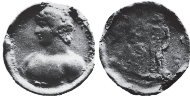
Typ 4.6: AE Korinth, Antinoos / Isthmos. G. Blum, Numismatique d'Antinoos, JIAN 16 (1914) Taf. I, 14.