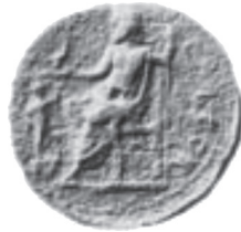
Abb. 3: AE, Korinth. Lucius Verus / Poseidon. F.W. Imhoof-Blumer and P. Gardner, Ancient Coins Illustrating Lost Masterpieces of Greek Art. A Numismatic Commentary on Pausanias (Chicago, 1964) Taf. D LVI.

wäre ikonographisch eine Wesensähnlichkeit zu Poseidon gesucht worden. Im konkreten Kontext der Medaillons, die—wie noch zu zeigen sein wird—jeweils eine Disziplin der Isthmischen Spiele aufgreifen, verkörpert Antinoos als poseidonähnlicher Heros den nautischen Aspekt der Isthmia, welcher nicht nur topographisch gegeben war, sondern in den Spielen durchaus auch einen Ausdruck fand: Zu Ehren des Poseidon wurden Schiffsrennen abgehalten. Als prominentester mythischer Sieger jenes Agon war das Schiff der Argonauten, die Argo, mit einer Pinie bekränzt von den Gewinnern dem Poseidon geweiht worden (Dion Chrys. 37, 15).