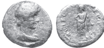
Abb. 20: AE, Nikopolis. Antinoos / Asklepios. Münzkabinett Berlin, Objektnummer 18208500. http://www.smb.museum/ikmk/object.php?objectNR=4 .

gegenwärtigen Ruhm ihrer Vorfahren zur Förderung ihres Anliegens zu nutzen. 69 Falls Epiktet im Jahr 132 nicht mehr gelebt haben sollte, wird Hadrian sein Grab aufgesucht haben, und vermutlich wird er nicht versäumt haben, dem berühmten Schlachtfeld einen Besuch abzustatten, so wie es auch für Philippi zu vermuten steht. Der weitere Verlauf der Rückreise nach Rom ist numismatisch nicht greifbar, da der kaiserliche Tross damit den Bereich der „Greek Imperials“ verließ.