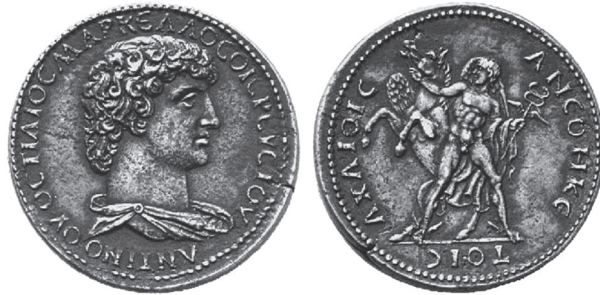
Abb. 1: AE Paduaner, Antinoos / Bellerophon mit Kerykeion. BCD Korinth: Sammlung BCD. Münzen von Korinth , bearbeitet von F. Eggers. Numismatik Lanz, Auktion 105, 26. November 2001, München, Nr. 649.

zudem etwas flau geprägt. Offenbar tat man sich schwer, bei der Prägung von Großbronzen dieses Durchmessers den nötigen Druck zu erzeugen, um eine scharfe Ausprägung der Stempel zu erzielen. In der Münzstätte von Korinth fehlte wohl die notwendige Erfahrung, waren doch alle anderen Produkte dieser Münzstätte durchgehend bis zum Ende der Prägertätigkeit in severischer Zeit nicht größer als ein römisches As. Deshalb, aber auch wegen des außerordentlich begabten und daher gewiß nicht einheimischen Stempelschneiders dürfte die Serie des Hostilios Markellos als Sonderemission zu betrachten sein, deren Prägeanlass es zu ergründen gilt. 4