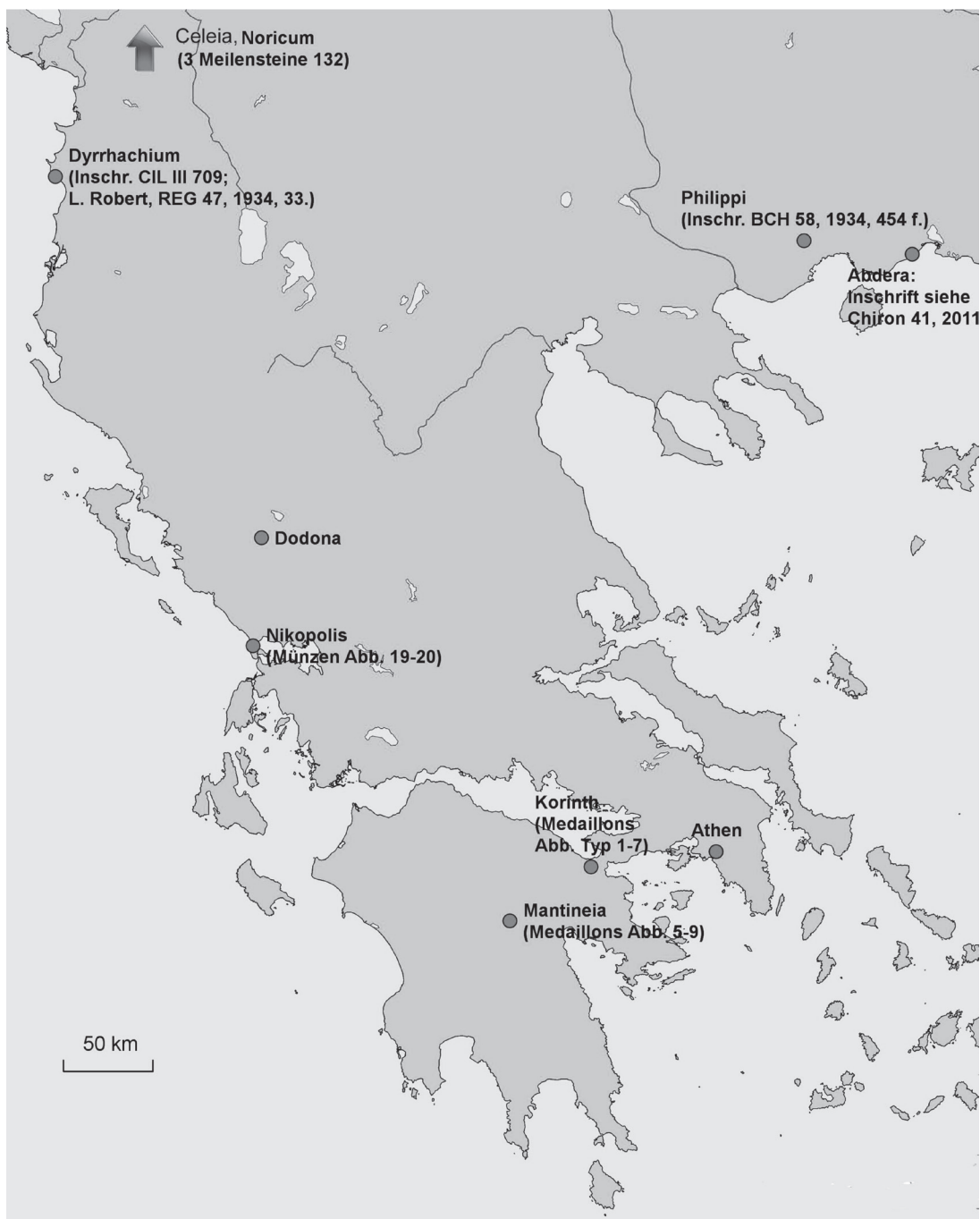
Karte 2: Stationen Hadrians in Griechenland 131/2 n. Chr.: Autor.